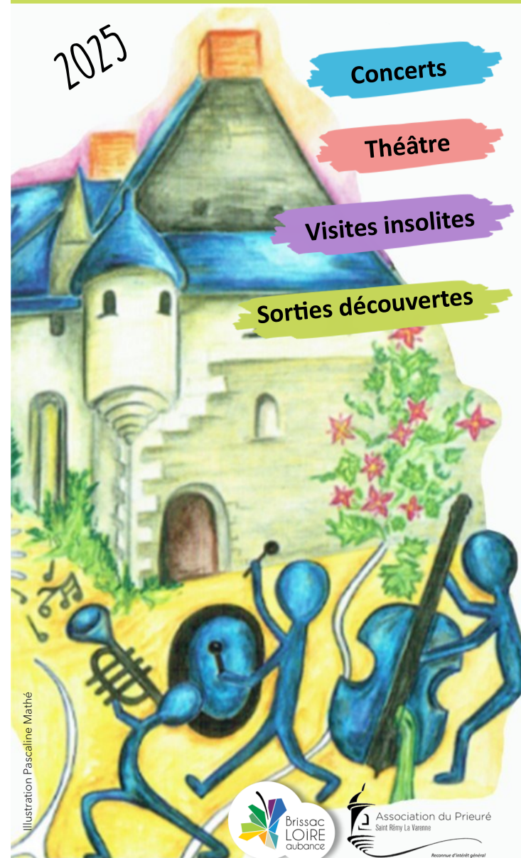
Illustration Pascaline Mathé